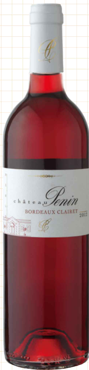
シャトー・ペナン クレレ 2012 1,680 円 「イチゴのような果実味がたっぷり、 上品な渋みと酸味とのバランスが良い “飲みごたえのあるロゼ”です」