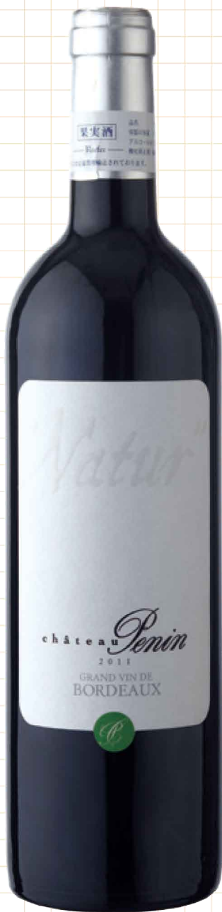
シャトー・ペナン ナチュラル 2011 1,880 円 「ブラックチェリーやカシスの様な果実味と さわやかでキレの良い後味が特徴的です。 今までのボルドーの赤とはひと味違う美味しさです」